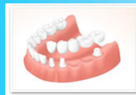
失った歯の両側を削るブリッジ治療

基本的にインプラントは、歯を失った部分のみを治療する方法なので、他の歯を削ったり、過剰な負担をかける必要はありません。