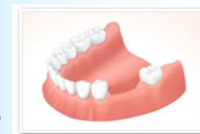
歯を失い、やせてしまったはぐき

歯を失った後、歯の根を支えていた骨は力の伝達が無くなるためその役割を失い、ある程度の細さになるまで自然に吸収し、やせていきます。 インプラントならば、咬む力をしっかりと骨に伝えてくれますので時間が経っても骨はやせません。